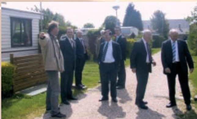
Op 23 mei bracht de fractie een werkbezoek aan Goeree-Overflakkee. We bezochten het dijkversterkingsgebied "Het Flauwe Werk", bij Ouddorp, enkele campings en het Van Weel Bethesda Ziekenhuis in Dirksland. 's Avonds spraken we met lokale bestuurders van SGP en ChristenUnie over regionale aangelegenheden.

Verder gaf hij aan dat er meer recreatieterreinen nodig zijn, zo'n 28.000 hectare (waarvan 15.000 hectare nog moeten worden aangekocht). Hij sloot af met de opmerking: "Het is niet óf woningbouw óf economie óf recreatie maar én, én, én."