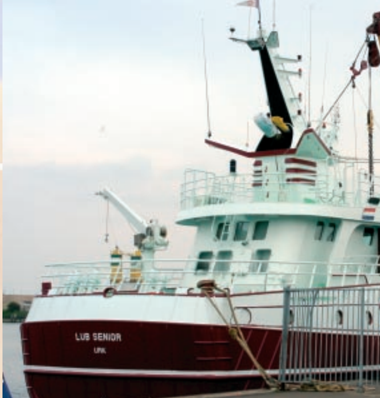
Kotter in de haven van Stellendam

De fractie SGP/ChristenUnie heeft in 2005 tot twee keer toe vragen gesteld over de problemen in de zeevisserijsector in Zuid-Holland. Wij constateerden toen al dat deze sector in zwaar weer aan het raken was. Deze veronderstelling werd gebaseerd op economische informatie over de sector met betrekking tot onder meer werkgelegenheid, de te verwachten ontwikkelingen in de zeevisserij, de positie van zeevisbedrijven en de kansen en bedreigingen voor de binnen de provin-