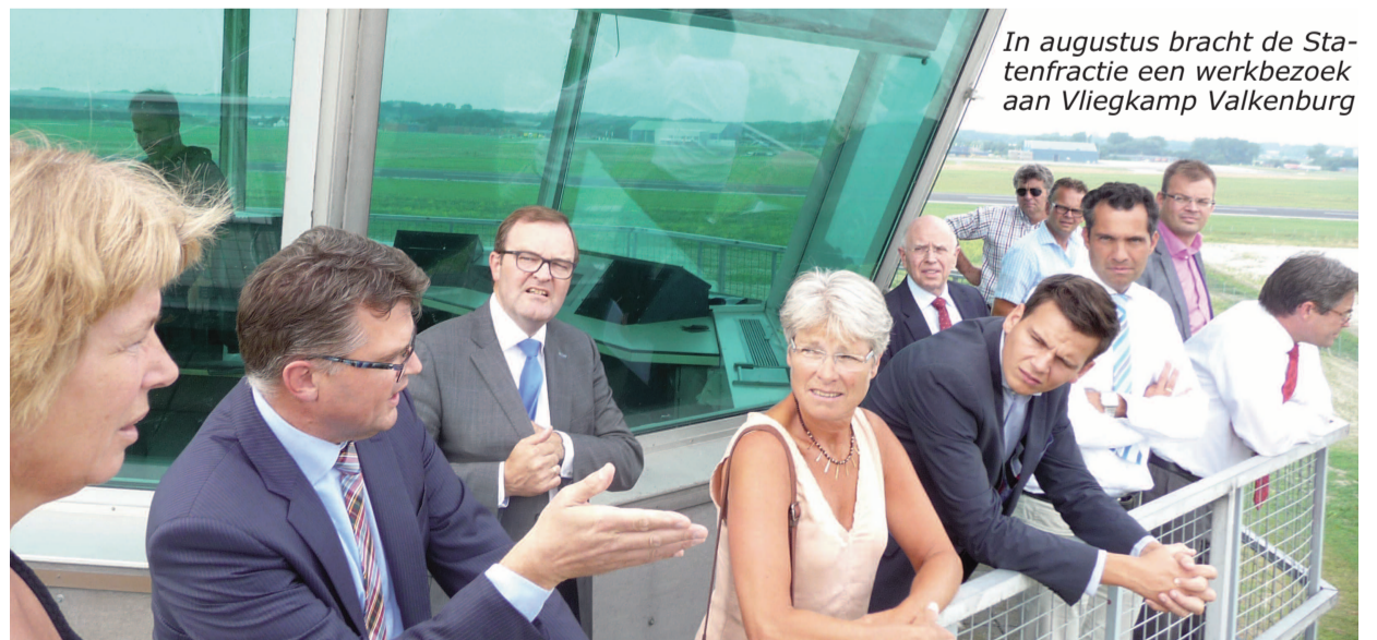
In augustus bracht de Statenfractie een werkbezoek aan Vliegekamp Valkenburg