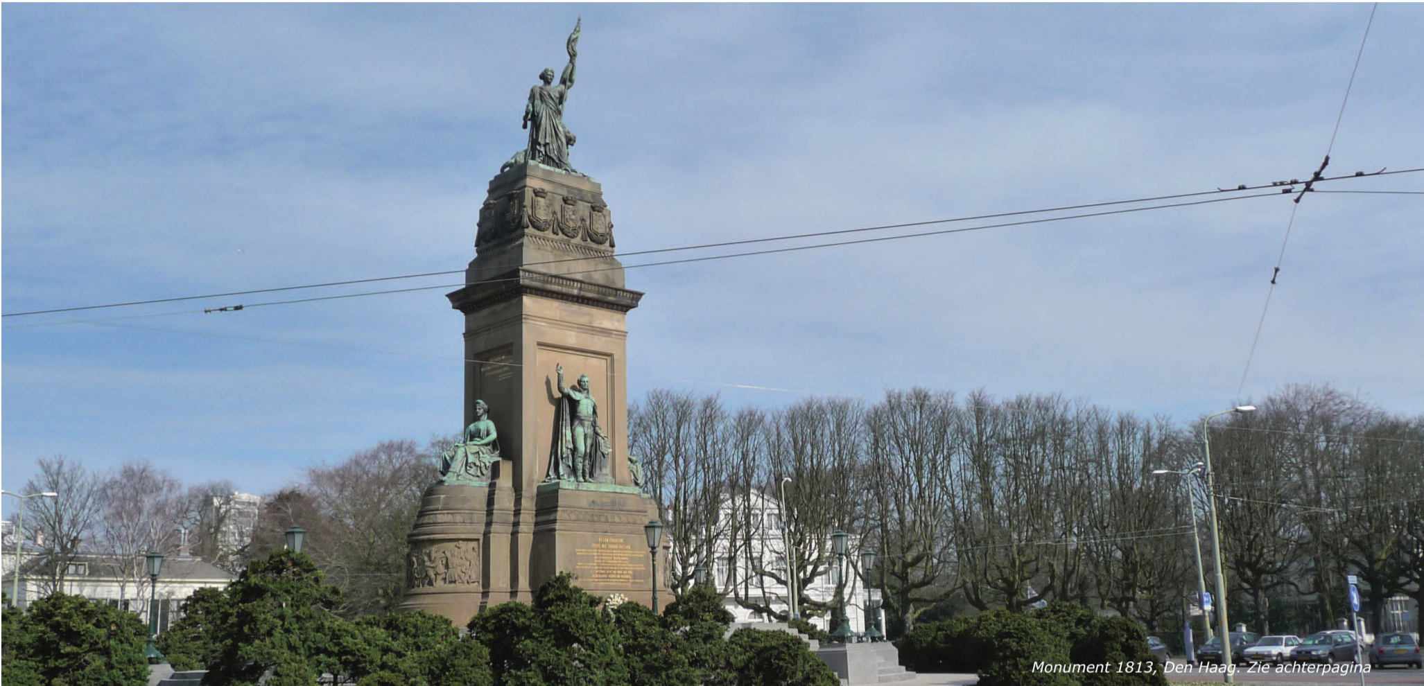
Monument 1813, Den Haag. Zie achterpagina