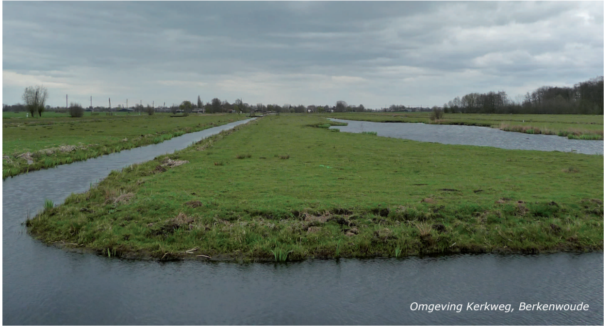
Omgeving Kerkweg, Berkenwoude

Vanaf de vijftiende eeuw bouwde men molens om het land droog te houden. De onttrekking van water had tot gevolg dat de grond daalde (inklonk) en zo werd ook de veeteelt in het ge-bied steeds moeilijker. Men wilde de turfwinning