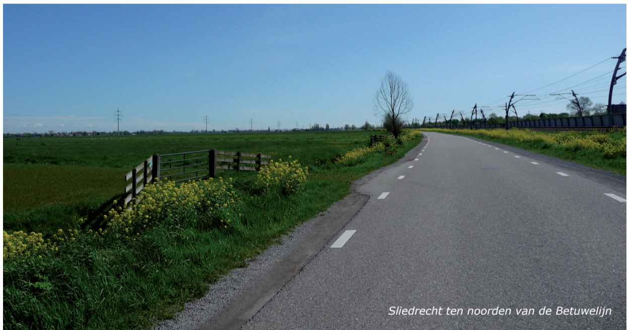
Sliedrecht ten noorden van de Betuwelijn