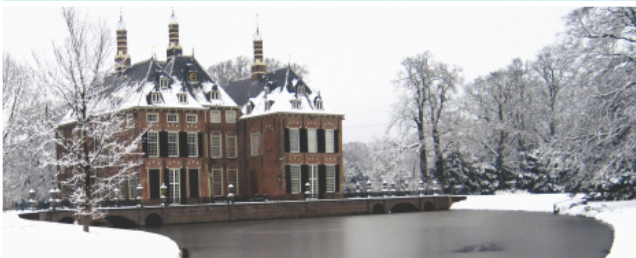
Bovenstaand kasteel heeft als kraamkamer van het huidige coalitie-akkoord gediend.