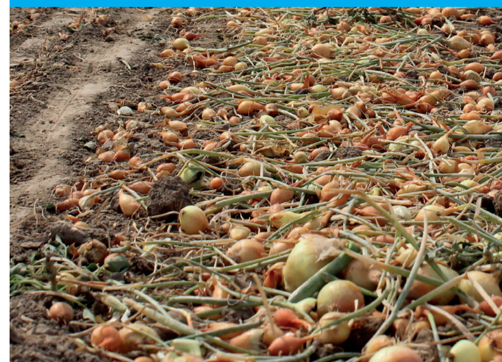
Door de droogte zijn veel uien niet volgroeid

waterschapsbestuurder ChristenUnie bij Waterschap Rivierenland